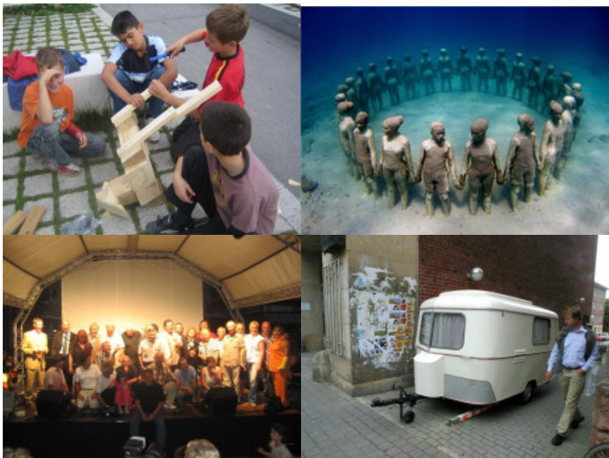
Von unten links im Uhrzeigersinn: Künstlerfest zur Eröffnung von „Haltestelle!Kunst 2007“ in Nürnberg – beteiligt waren 39 Künstler, davon viele sculpture network-Mitglieder | Während des Rahmenprogramms bauten Kinder eigene Skulpturen | Unterwasser-Skulptur von Jason Taylor auf Grenada/Karibik | Der bei der Kunstaussstellung "skulptur projekte 07" in Münster gestohlene Wohnwagen – eine Skulptur des amerikanischen Künstlers Michael Asher – ist nach wenigen Tagen in einem Ort etwa zwölf Kilometer entfernt wieder entdeckt worden.