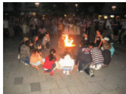
Mit großer Begeisterung hatten die Nürnberger Schulkinder eine Tanz - Performance einstudiert

Und die Jugend kam in Nürnberg nicht zu kurz. Schon während der Vorarbeiten waren zahlreiche Aktivitäten für Kinder veranstaltet worden und auch der multi-kulturelle Eröffnungsabend war zugleich ein großes Kinderfest. Unser griechisch-deutsches Mitglied Mirko Siakkou-Flodin hatte die Kinder einer nahegelegenen Schule gebeten, sich eine eigenständige Tanz-Performance zu seiner Skulptur auszudenken. Sie tanzten zur Musik von Carl Orff, während im Hintergrund langsam aus einem brennenden Stroh-Feuer eine glühende Skulptur von Mirko erschien.