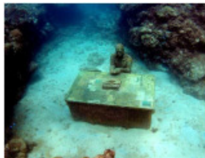
Jason Taylor: „The Lost Correspondent“, installiert in einer Tiefe von 7 m.

Wir alle wissen ja, dass der Grossteil der Erdoberfläche von Wasser bedeckt ist. Unsere Meere bergen unzählige Geheimnisse: gesunkene Schiffe, antike Skulpturen, ja ganze versunkene Städte und Kulturen. Wie spannend sind doch Berichte über die Entdeckung eines gesunkenen Schiffswracks mit einer geheimnisvollen Fracht. Das gibt immer schöne Schlagzeilen und belebt den Tourismus, vor allem auch durch Tauchsport-Fans. Zuerst kamen Experten auf die Idee, neue künstliche Riffe unter Wasser zu installieren (s.a. newsletter Oktober 2006). Und jetzt haben sich auch Bildhauer der Sache angenommen.