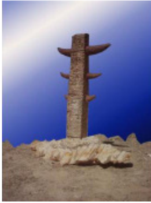
Erhan Karadag, Ohne Titel, 2005, Marmor, ca. 150x50x100 cm.

Mittlerweile hat die Idee auch im europäischen Raum Fuß gefasst: Im September 2005 wurde eine Unterwasser-Skulpturen-Ausstellung in der Bucht von Kiris-Kemer bei Antalya in der Türkei eröffnet. In einer Tiefe von 12 Metern wurden dort Werke von 13 Künstlern aus Erzurum und Antalya versenkt. Alle Skulpturen sind aus Marmor und werden jeweils im Winter wieder geborgen. Inzwischen weisen die Skulpturen einen sehr schönen Bewuchs mit Seepocken und Schwämmen auf. Fische sind in Hohlräume eingezogen und bilden eine interessante Symbiose zwischen Natur und Kultur.