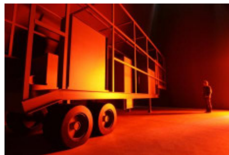
„Phantom Truck“ des Spaniers Inigo Manglano-Ovalle

Damit rächt sich die bisherige Medienarbeit des „Taschenspielers“ Buergel ( Taz ). Es war nämlich der künstlerischen Leitung der documenta 12 bis zum Schluss gelungen, mit einer Doppelstrategie aus Geheimhaltung und Personalisierung sowohl die Erwartungshaltungen hochzuschrauben wie auch inhaltlich beinahe gar nichts preiszugeben. Statt Künstlerlisten hatten Buergel und Noack immer wieder philosophische Leitgedanken geliefert. Und auf die Pannenserie wurde nun reagiert, indem das Geschehene flugs umgedeutet wurde. Buergel gestand ganz offen ein, dass es „...immer klar [war], dass es Probleme geben würde. Wir hatten gehofft, dass wir uns durchmogeln können. Aber das hat nicht funktioniert.“