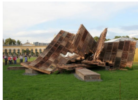
Ein Unwetter zerstörte am 20.06.2007 die Arbeit

Ai Weiweis Arbeiten befassen sich vielfach mit Bewahren, Verschwinden und Zerstören kultureller Zeichen und Praktiken. So ist der Einsturz eine im Kontext, mit der Furie des Verschwindens in der Moderne also nahezu logische Lösung. So wird Template als Ruine ein neues Bild ergeben, mithin eine Chiffre für eine der drei Leitfragen der Ausstellung „Ist die Moderne unsere Antike?“