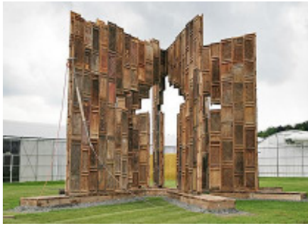
Ai Weiwei „Template“, 2007, Skulptur aus alten Holztüren und Fenstern von in China abgerissenen Häusern – hier vor der Eröffnung bei der Überprüfung der Statik

Auf der documenta 12 hat ein heftiges Unwetter Ai Weiweis Skulptur „ Template “ zerstört. Sie fiel in sich zusammen, spiralförmig, auf eine gewissermaßen ästhetische Weise, wie die Bilder zeigen. Glücklicherweise kamen dabei keine Personen zu Schaden. Der Künstler war von der durch die Zerstörung neu entstandenen Form sogleich begeistert, sie sei schöner als zuvor. Er hat sich entschieden, die aus jahrhundertealten Türen und Fenstern chinesischer Tempel bestehende Skulptur nicht wieder neu aufzubauen.