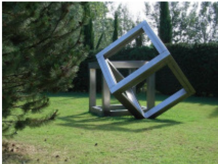
Alf Lechner „Würfelkonstruktion“

Noch kurz vor seinem Tode hatte Salinger die Stiftung im Sommer 2004 gegründet. Das Museum mit Kennedy-Memorabilia und der Skulpturenpark gehören zu einer alten Wassermühle, die zugleich auch ein romantisches Hotel und ein Feinschmecker-Lokal ist. Bereits im Jahre 2005 hatte man eine grosse Skulpturenausstellung mit Werken von Nikki de Saint-Phalle veranstaltet und im letzten Jahr eine Werkschau mit Keith Haring.