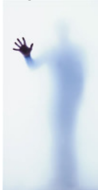
„Blind Light“ at Hayward Gallery, London, Mai 2007