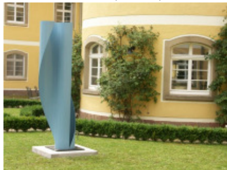
Eine der „Pliagen“ im Skulpturenpark