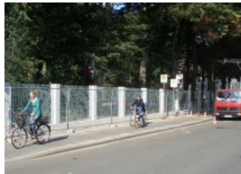
Noch bei der Installation: „Annie“ könnte bald zum Wahrzeichen der Gerisch-Stiftung werden.

Und die Stiftung hat auch mit einem Clou aufzuwarten: der bekannte Bildhauer Olaf Nicolai hat eine besondere skulpturale Park-Eingrenzung entworfen. Die Glaswand ist etwa 150 m lang und 2,10 m hoch. Inspiriert dazu hat ihn der Oscar-preisgekrönte Film „Misery“ von 1990. Nicolai hat seiner Arbeit daher auch den Namen der Hauptperson dieses Filmes gegeben. Mit „Annie“ baut Nicolai eine Art Filter, der sich als Gardinenmuster vor unsere Wahrnehmung des Parks legt. Der Blick in den Park wird zum voyeuristischen Abenteuer! Damit gibt der anspielungsreiche Glaszaun auch der Leitlinie des Gerisch - Skulpturenparks - „Wo liegt Arkadien?“ - eine ganz besondere, mystische Bedeutung.