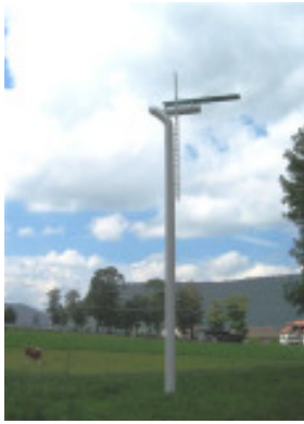
„Diving Platform“ mit Kühen

Noch bis zum 23. September läuft die open-air-Skulpturen-Ausstellung in Môtiers. Seit 1985 finden die Ausstellungen in der schweizerischen Romandie statt und in diesem Jahr ist es die 5. Ausgabe. Doch anders als beim deutschen Namensvetter Münster – so heisst Môtiers übersetzt – muss man hier schon weg aus der City weitab ins idyllische Val-de-Travers reisen. Aber die Reise lohnt sich!