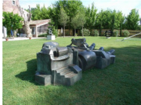
Eduardo Paolozzis fast vier Tonnen schwere „Hand“ – der Name der Skulptur ist eigentlich „Egypt“ – im Park