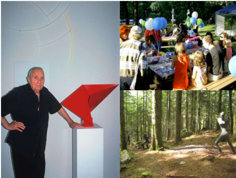
Von links: Gottfried Honegger feierte seinen 90. Geburtstag. Anlässlich seiner Ausstellung im Skulpturenpark der Orthopädischen Universitätsklinik in Heidelberg veranstalten wir am 22. September ein Regional Member Meeting | Zur „Langen Nacht der Museen“ kamen über 600 Besucher in die Bernhard-Heiliger-Stiftung. Berlin. Für die Kinder wurde ein spannender Mal- und Bastelwettbewerb organisiert | Wie geheimnisvolle Fabelwesen begegnen einem die expressiven Skulpturen von Martin Disler im Wald von Môtiers – eine grossartige Hommage an den 1996 verstorbenen Künstler.