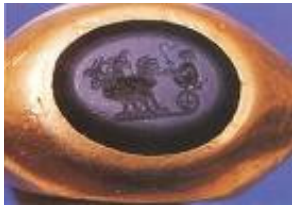
Goldring mit Gemme, Landesmuseum für Kärnten, Klagenfurt

Unter einer Gemme (lateinisch gemma : Knospe, Edelstein) versteht man einen geschnittenen Edelstein oder Halbedelstein. Daraus leitet sich auch der Fachbegriff für Edelsteinkunde ( Gemmologie ) sowie die Bezeichnung des Steinschneiders ( Gemmarius ) ab. Früher wurden Gemmen oft in schönen Behältnissen, den Daktyliotheken, aufbewahrt – die waren einst der Schlüssel zur Kenntnis der antiken Kunst schlechthin. Heute versteht man unter einer Gemme meist einen vertieft geschnittenen Schmuckstein: Das Bildmotiv wird in den Stein eingeschnitten.