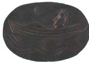
Ludwig Gies (D): »Die Grosse Gelassenheit« . Kunst-Medaille aus der Sammlung eines Mitglieds

Mit dem Ende des 19. Jahrhunderts geriet die Kunstform des Medaillen-Schneidens immer mehr in Vergessenheit. Nach dem Ende des 2. Weltkriegs erlebte sie noch einmal eine Blüte vor allem in den osteuropäischen Staaten. Aufgrund des Mangels an teurem Material für Güsse größerer Skulpturen konzentrierten sich viele Künstler auf kleinformatige Kunstmedaillen. Mit dem Fall des „Eisernen Vorhangs“ hat sich aber auch diese Entwicklung überholt.