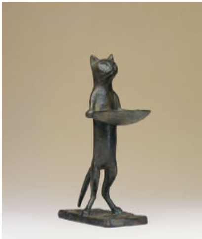
Diego Giacomettis berühmte Skulptur »Le chat maître d'hôtel« (3. Fassung von 1967)

Eine sehr empfehlenswerte Ausstellung wird zurZeit im Wintersport-Ort Flims in Graubünden gezeigt: Werke von Diego Giacometti (1902 – 1985), dem jüngeren Bruder des weltberühmten Alberto. Seit zwei Jahrzehnten hat es im Heimatland von ihm keine Ausstellung mehr gegeben (letztmals 1988 im Museum Bellerive in Zürich), und auch international wurde das Werk des Bündner Künstlers kaum gezeigt. Diese erste Ausstellung in der engeren Heimat des Künstlers zeigt rund 100 exemplarische Arbeiten von Diego Giacometti, dessen Skulpturen auf dem internationalen Markt inzwischen sehr hohe Preise erzielen.