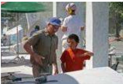
Besonders Kinder waren interessierte Zuschauer und wollten alles wissen