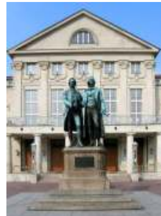
Das Goethe-Schiller-Denkmal in Weimar

Rietschel wurde 1804 im kleinen Ort Pulsnitz geboren, ca. 30 km von Dresden entfernt, wo er 1861 starb und begraben liegt. Er war mit vielen Künstlern seiner Zeit bekannt, so mit Goethe, Carl Maria von Weber, David d'Angers etc.. Man ernannte ihn zum Ritter des preußischen Ordens Pour le Mérite für Wissenschaft und Künste und zum Ehrenmitglied der Akademien von Berlin, Wien, Brüssel, Antwerpen und Kopenhagen, ferner zum Mitglied des Institut de France und der römischen Accademia di San Luca.