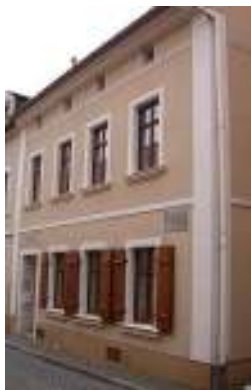
Das Geburtshaus von Ernst Rietschel

Nachdem zuerst 1933 eine "Ernst-Rietschel-Kapelle" in der Pulsnitzer St. Nicolai-Kirche eingerichtet wurde, konnte 1990 nach der Wiedervereinigung Deutschlands der Ernst-Rietschel-Kulturring gegründet werden. Im Jahre 2000 wird das Geburtshaus Ernst Rietschels restauriert und von der Stadt Pulsnitz dem Ernst-Rietschel-Kulturring zur Nutzung als Archiv- und Ausstellungsort übergeben.