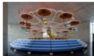
„RB Ride“, 2007