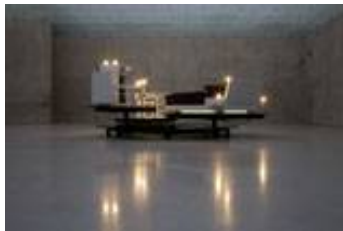
Ein besonderes Erlebnis: das „Drehende Hotelzimmer“ im KUB von Carsten Höller

Hand aufs Herz: Wer hat nicht schon einmal davon geträumt, ein ganzes Museum nur für sich zu haben und dort eine Nacht allein verbringen zu dürfen?