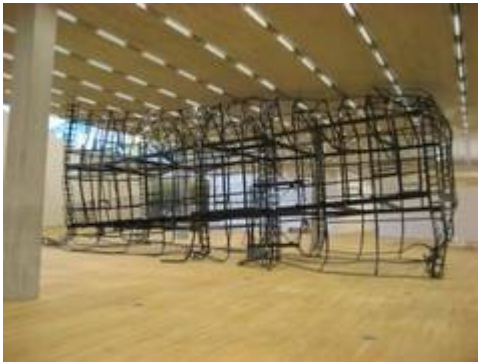
Monika Sosnowskas Stahlskelett einer typischen Plattenbau-Konstruktion wurde auf der Biennale Venedig 2007 gezeigt. Nun wurde sie so verformt, dass sie in den niedrigeren Pavillon passt.

„1:1“ - Monika Sosnowska (PL) und Andrea Zittel (USA) im Schaulager, Basel (CH)