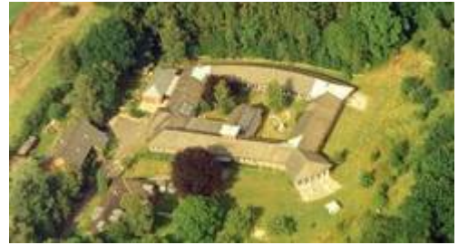
Im Nordosten Hamburgs liegt in einem Landschaftsschutzgebiet das Haus am Schüberg

Sie mögen sich fragen: Warum wurde das „Haus am Schüberg“ Mitglied bei sculpture network? Es ist doch das ökumenische Tagungs- und Bildungszentrum der Evangelischen Kirche in der Metropolregion Hamburg in Norddeutschland. Natürlich ist es ein Ort, an dem Menschen aus unterschiedlichen Kulturen, Lebensbereichen und Berufen miteinander ins Gespräch kommen und voneinander lernen – Networking wird dort also betrieben. Aber ist das ein Grund für eine Mitgliedschaft?