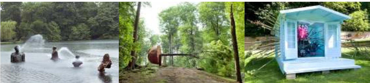
Von links: Fernando Sánchez Castillo „Spitting Leaders“ | Michel François: „Appearance of a Tree“ | Gerda Steiner & Jörg Lenzlinger „Mystery of Fertility“

Tilroe hat weniger bekannte Künstler ausgesucht und auf die gängigen „big names“ verzichtet. Wir hoffen, dass dieses Experiment gelingt und viele Besucher kommen werden. Denn an der Besucherzahl wird später gemessen, ob die traditionsreiche Veranstaltung weiter leben wird – und das wünschen wir uns natürlich sehr!