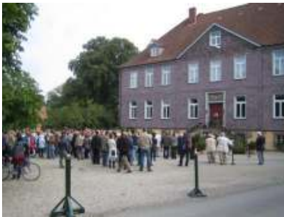
Vernissage von NKiaG im Jahre 2006

Anlässlich der Vernissage der 3. Ausgabe vom NKiaG laden wir Sie ein in die Landschaftsparks von Obergut und Untergut in D - 30989 Lenthe, nicht weit von Hannover entfernt.