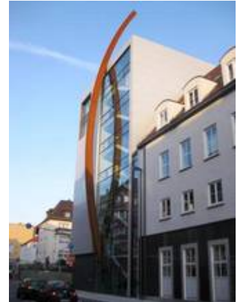
Ein kühner Bau: das Venet-Haus in Neu-Ulm

Herausgekommen ist ein kühner, ja atemberaubender Bau mit einem markanten Bogen. Der Bogen aus Stahl tritt in knapp drei Metern Höhe aus dem Gebäude heraus, wölbt sich über die gesamte Fassade, spiegelt sich darin und ragt über sie hinaus in den Himmel.