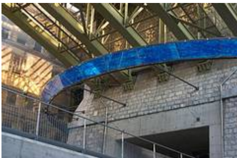
Die Station Bessières wurde in einen Tunnel unterhalb einer Brücke gebaut

Im September wurde die erste U-Bahn der Schweiz eingeweiht – die Metro M2 in Lausanne am Genfer See. Bahntechnisch ist sie ein Fall für sich, denn es ist die steilste Metro der Welt und hat zehn „schiefe“ Stationen. Sie ist vollautomatisch und wird wie von Geisterhand gelenkt.