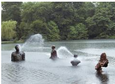
In der Tradition barocker Wasserspiele spucken sich vier Staatschefs und Diktatoren gegenseitig an: Stalin spuckt auf Louis XIV, der auf Hitler, der auf Franco und der wiederum auf Stalin usw.

Die „10th Sonsbeek International Sculpture Exhibition“ ist nach 100 Tagen mit grossem Erfolg beendet worden: Zwischen 110.000 bis 120.000 Besucher sahen die Ausstellung. Dazurechnen muss man noch die über 30.000 Zuschauer der Anfangsprozession (s. Juni Newsletter) und die über 1.000 Einwohner, die bei der Prozession mitgewirkt hatten.