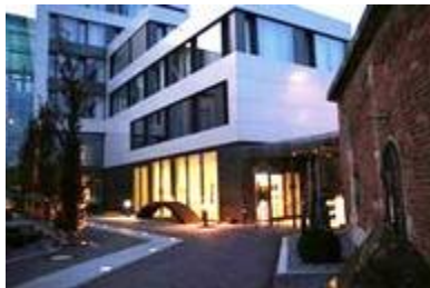
Die Galerie im Innenhof