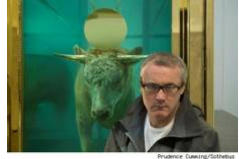
„The Golden Calf“ erzielte 10,34 Millionen Pfund – warum schaut Hirst dann so böse?

Mit geschätzten 200 Millionen Pfund Vermögen war der 43 Jahre alte Skandalkünstler bereits der reichste lebende Künstler Grossbritanniens. Hirst wurde in den neunziger Jahren mit Schock-Schauen der sogenannten Young British Artists bekannt und machte unter anderem mit einem in Formaldehyd eingelegten Hai und einem mit Diamanten besetzten Totenschädel Schlagzeilen. Er beschäftigt ein Heer von Assistenten, die den grössten Teil seiner Werke wie Laborschränke oder seine Punkt- und Spritzbilder herstellen.