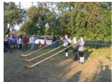
Die Alphornbläser aus Kluftern

Diese steht mitten auf einer wunderschönen alten Streuobst Apfel-Wiese mit einem weiten Landschaftsblick und lädt die Besucher ein, sich mit dem Panorama der Bergketten und der Struktur des Bodensees auseinanderzusetzen.