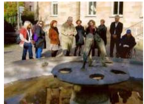
Impressionen vom Regional Members Meeting in Neumarkt

Unsere Besuchergruppe startete nach der Begrüßung durch Dr. Pia Dornacher und Dr. Gabriele Moritz vom Kulturamt zu einem Rundgang durch die Stadt, bei dem vor allem das Thema zunächst größerer Widerstände gegen die Aufstellung von Werken Fischer's lebhaft diskutiert wurde. Als Vorbereitung auf den Bau des Museums begann es 2002 mit Drei Reiter , was zu harten Kontroversen in der Bevölkerung führte, und viele Aktionen der Verständigung durch unsere Gastgeberinnen und weiterer Persönlichkeiten bedurfte. Ein mühsamer aber am Ende erfolgreicher Prozess.