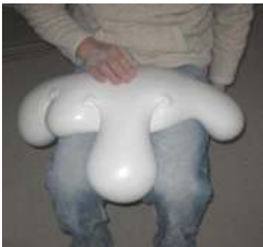
Ein „Helotroph“ wird in der Tram spazieren gefahren – wie werden die Fahrgäste reagieren?

Aber die drei gehen noch weiter und haben eine witzige und kreative Idee entwickelt. Im Rahmen des Projekts findet an den beiden Tagen vor der Eröffnung eine Kunst-Aktion mit einer Skulptur von Venske & Spänle statt: ein „Helotroph“ wird auf einer der meist-frequentiertesten Tram-Linien durch Zürich gefahren. Vom Bellevue, dem Herzen Zürichs, geht's jeweils bis vor die Haustür in Oerlikon – und wieder zurück. Studenten sitzen in der Tram und halten die Skulptur wie einen „Schoss-Hund“. Der „Helotroph“ ist aus strahlend weißem Laaser Marmor, der Kühle und Härte ausstrahlt. Durch die sich an den Körper anschmiegende Form wird die in eine Anmutung von organischer Weichheit und Wärme transformiert. Mit dieser subversiven Aktion brechen Venske & Spänle alltägliche Abläufe durch eine Intervention im öffentlichen Raum subtil auf und verfremden sie fast surreal.