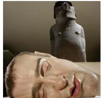
Mask II, Ron Mueck (2001-2002)

http://www.britishmuseum.org/whats_on/all_current_exhibitions/statuephilia.aspx