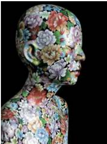
Human, Human - Cloisonné Bust 8 - Ten Thousand Flowers, 2005, 46 x 45 x 26 cm

Noch bis zum 16. November 2008 zeigt das Georg-Kolbe-Museum die erste europäische Retrospektive des 1960 in Peking geborenen und seit 1989 in Sydney lebenden Künstlers Ah Xian. Seine vorwiegend aus Porzellan gefertigten Figuren und Büsten sind von verschwenderisch-schönen Dekoren bedeckt, deren Motive aus der Kunst der Ming- und Qing-Zeit (14. bis 19. Jahrhundert) stammen. Gleich Tätowierungen überziehen sie die Körperbilder, die von lebenden Modellen aus dem Freundes- und Bekanntenkreis des Künstlers abgeformt wurden und deren Vokabular verschiedene Kulturen und Zeiten überspannt. Dabei werden auch Fragen nach der Identität Ah Xians aufgeworfen, der 1989 aus politischen Gründen China verlassen hatte.