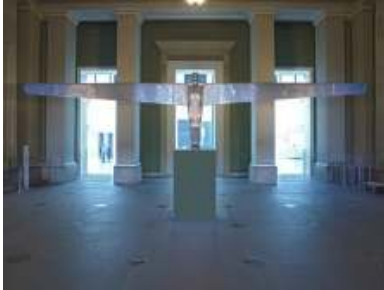
Antony Gormley: A CASE FOR AN ANGEL II, 1989, Foto: Jan Uvelius, © Courtesy of the artist and Jay Jopling / White Cube, London

Das British Museum besitzt eine der weltgrößten Skulpturen-Sammlungen. In der neuen Ausstellung „Statuephilia“, die noch bis zum 25. Januar 2009 zu sehen ist, werden nun bedeutende Skulpturen von fünf führenden zeitgenössischen britischen Künstlern in die Sammlung integriert. Damit wird ein historischer und über Jahrhunderte verbindender kultureller Kontext aufgezeigt.