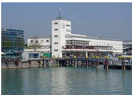
Jährlich kommen bis zu 300.000 Besucher ins Zeppelin Museum Friedrichshafen

Wir laden Sie wieder nach Friedrichshafen am Bodensee ein. Diesmal ist der Anlass die Ausstellung im Zeppelin Museum, an der zehn unserer Mitglieder teilnehmen.