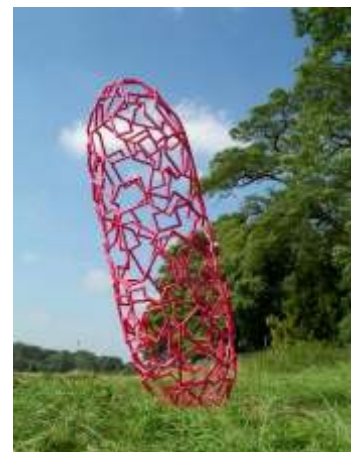
„System no. 24“ aus beschichteten Chromstahl-Röhren ist 4 Meter hoch

Die Skulptur steht auf einem kleinen Hügel, sie balanciert auf einer Kante und scheint im nächsten Augenblick zu kippen.