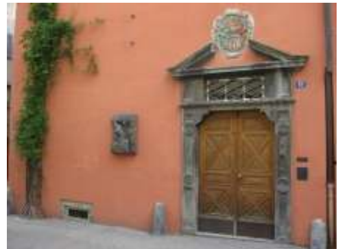
Wie selbstverständlich harmonisiert das Relief von Josephsohn mit dem historischen Portal